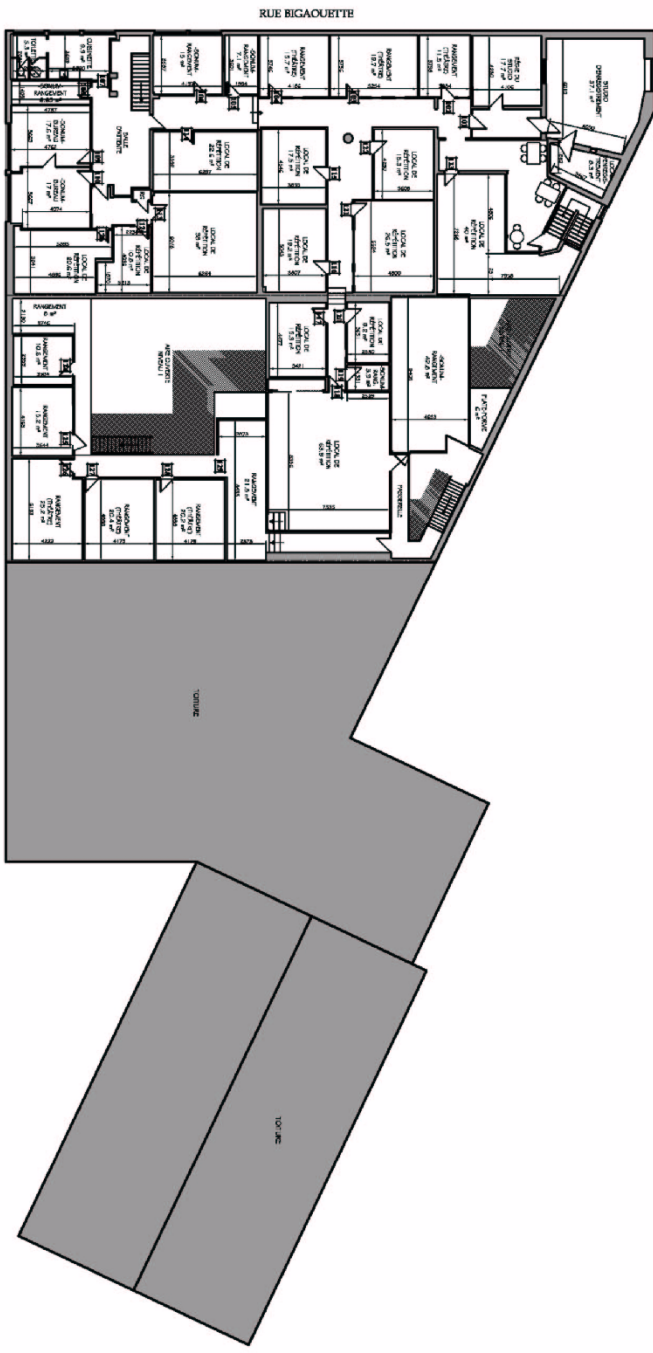
PLAN NIVEAU 2 - RELEVÉ ÉCHELLE: 1:250