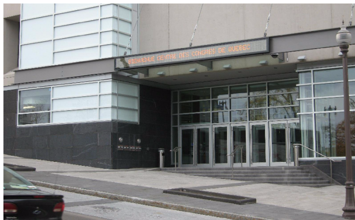
Entrée 900 avenue Honoré-Mercier