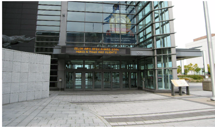
Entrée principal sud, 1000 boulevard René-Lévesque Est

Dossier 2006-09-082 1000 boulevard René-Lévesque Est