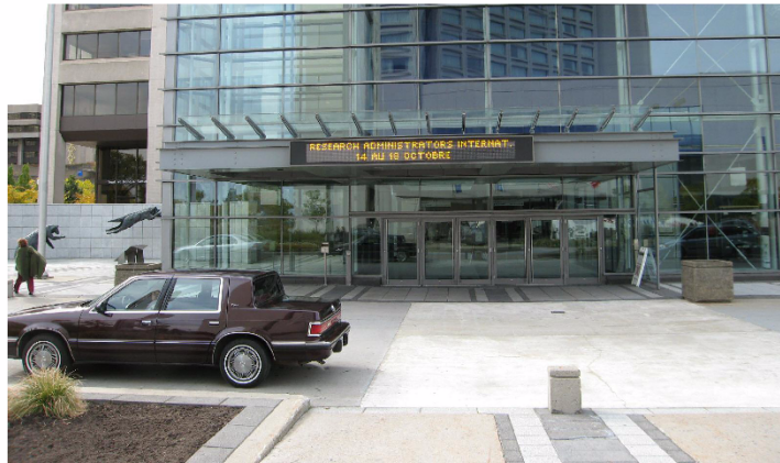
Entrée principal est, 1000 boulevard René-Lévesque Est